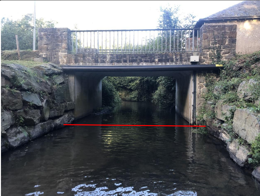
- Du pont aval