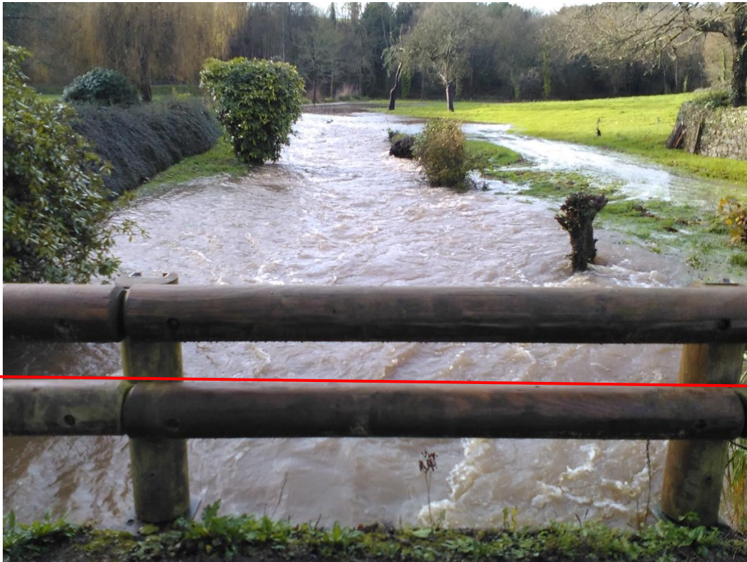
- Jaugeage en amont station prendre les deux bras