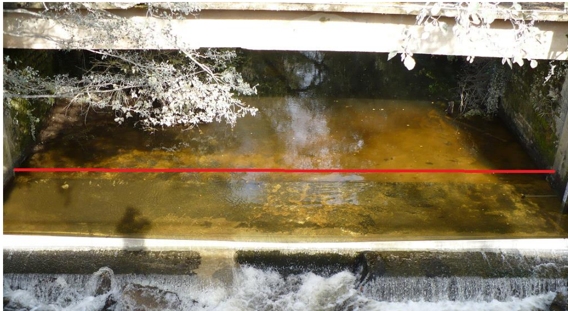
- Du pont station en aval sur le radier