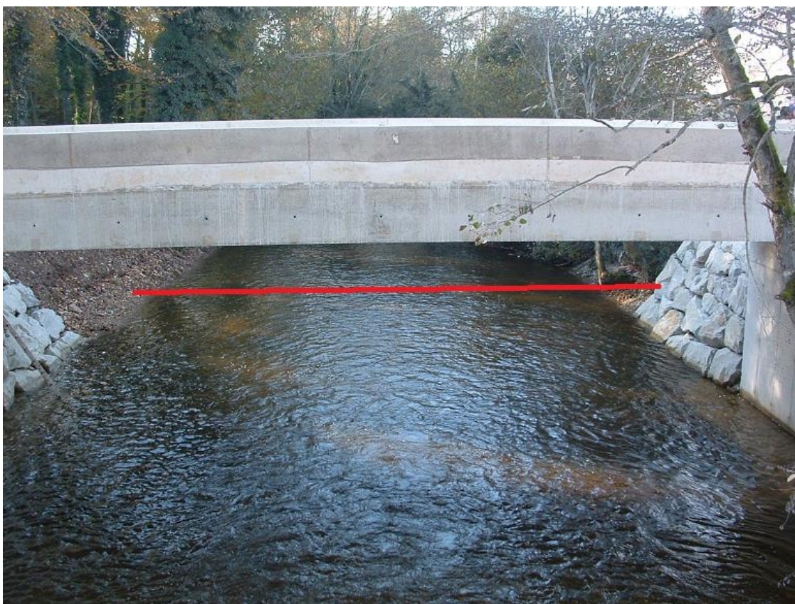
Du pont aval de la carrière 15 mètres en aval de la station.