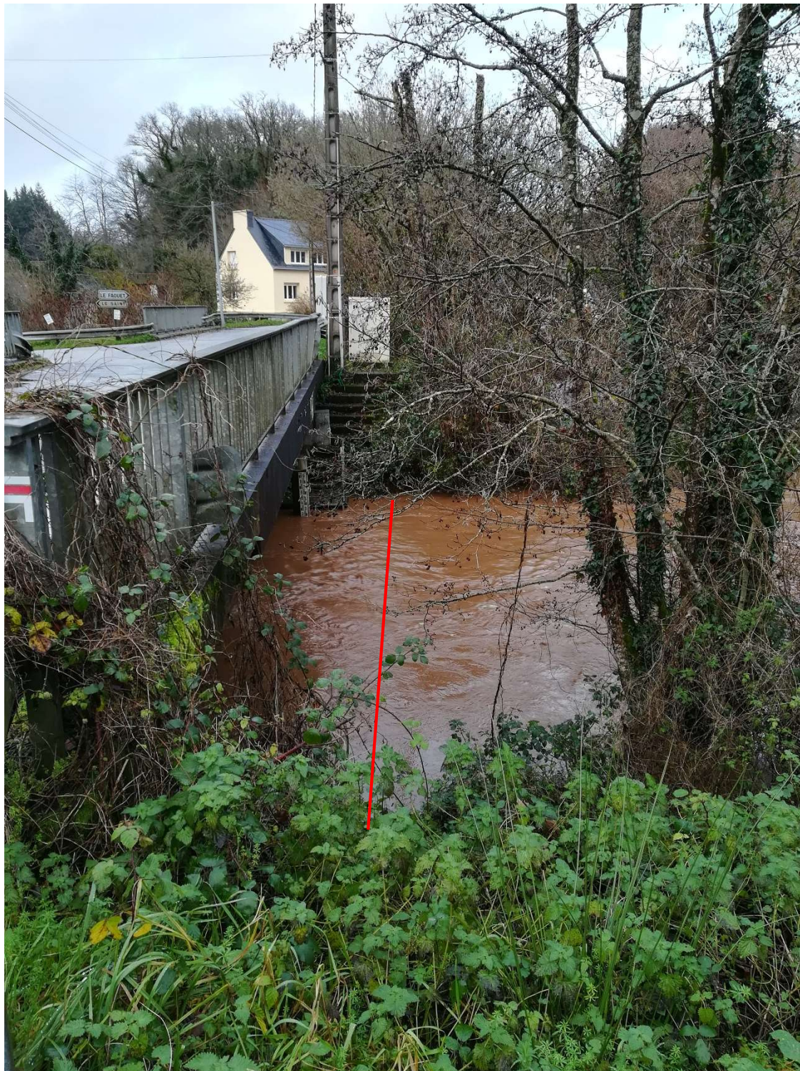
Pont de la station au lieu-dit Pont Priant (en aval)