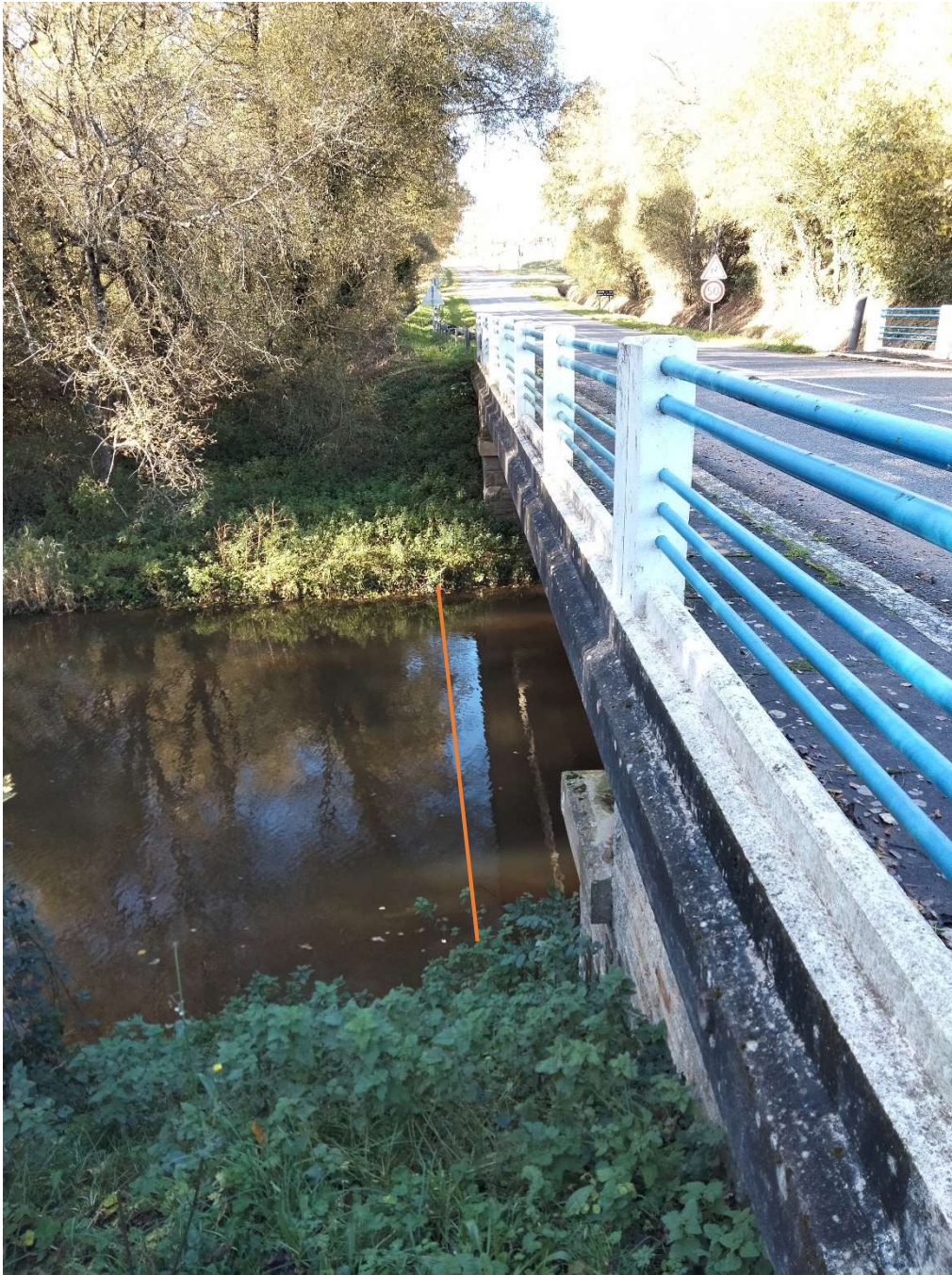
- Au pont de la station en aval.